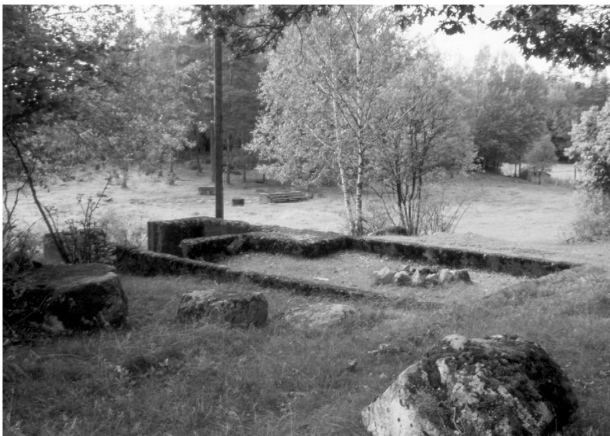
Gamla Folkparken. I förgrunden resterna av serveringen i bakgrunden trappan till dansbanan.

Att den hamnade vid Borgby Skans berodde på att man fick hyra platsen av Eriksson i Borgby. Sedan enades ett 15 tal organisationer i Kolbäck om att bilda en Folkets Parksforening. Detta skedde 1928. Att parken sedan vart flyttad år 1933 berodde på att Säby kommun, som Borgby skans ligger i, hade nöjesskatt och det hade inte Kolbäcks kommun. Då beslutades det att parken skulle flyttas till Kolbäcks kommun.